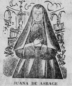
JUANA DE ASBAGE

Mujer extraordinaria esta mexicana de ascendencia vasca, que vivió la luz al pie del Popocatepetl en 1651 y que hasta su muerte heroica en 1695, contagiada de la peste adquirida por sus hermanas en religión, constituyó el orgullo y el asombro de su alden natal San Miguel de Nepantla y la de Villa de Amecameca primero, luego de la Corte Virreinal y de toda la Nueva España, y por último, de la América de habla española.