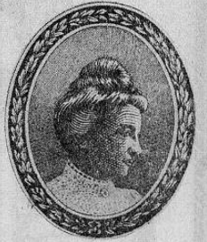
Clara Louise Maass

El país está preocupado por la fiebre amarilla que desde hace más de dos meses azota las distintas zonas de la capital, causando ya algunas víctimas, aún cuando a Dios gracias, pocas.