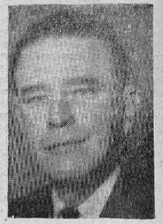
Don Otilio Ulate

desempeñarse en los Ministerios. En cuanto a que si confiaría otra Cartera a una de ellas, solo puedo decir que es circunstancial, y aún cuando me hubiese gustado tenerlas antes en el Gabinete, fué esa la razón de que así no sucediera, pues los Ministerios solo pueden ser confiados a quienes tengan suficiente preparación y capacidad intelectual".